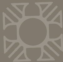
Wandelemente: Schiene DADO 5

Messe: EuroShop 2011, Düsseldorf Endkunde: SIGN-WARE® GmbH & Co. KG Ausführung: Skupin Design GmbH, Kaarst